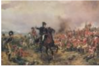
Anno e Battaglia