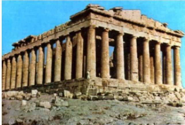
Il Partenone Atene 447 -438 a. C. ca