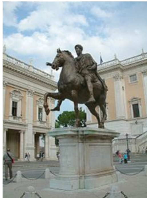
STATUA DI MARCO AURELIO 161-180 d.C. circa