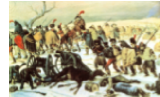
Anno e Battaglia