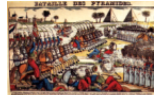
Anno e Battaglia