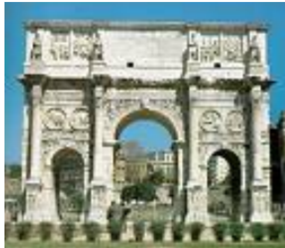
Arco di Costantino Roma - 315 d.C.