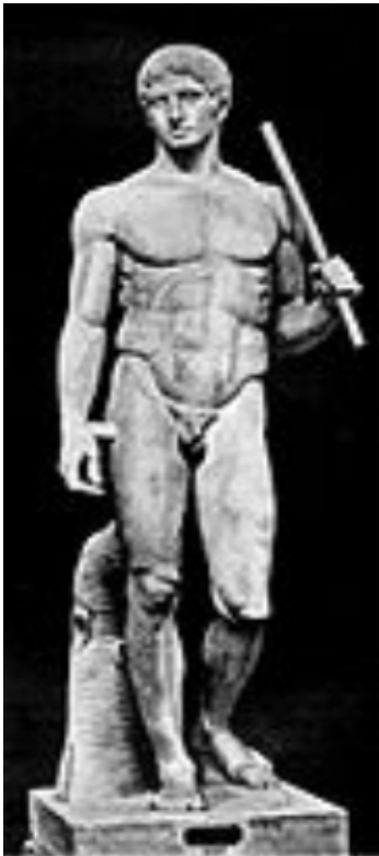
DORIFORO Policleto - 450 a.C. circa