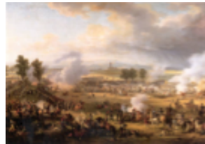
Anno e Battaglia