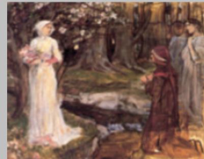
Dipinti che riproducono l'incontro tra Dante e Beatrice